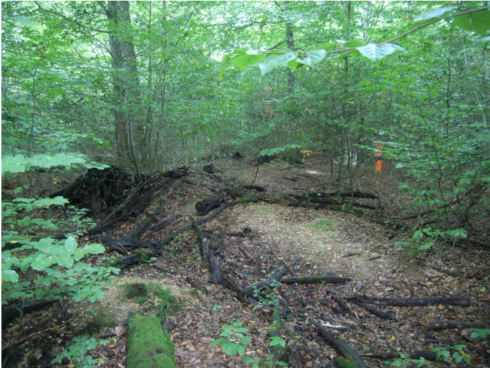
Zustand 2012