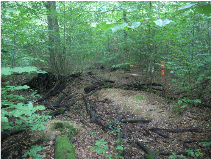
Zustand 2012