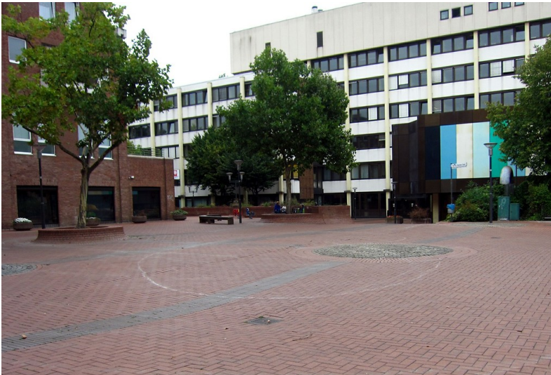
Platz der Deutschen Einheit in Frechen mit dem Rathaus (2013)