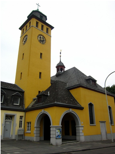
Evangelische Kirche in Frechen aus westlicher Richtung (2013)