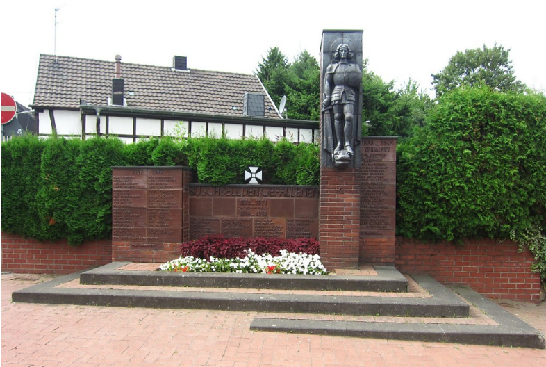
Das Gefallenendenkmal in der Ulrichstraße in Frechen-Buschbell (2013).