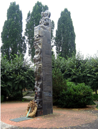
Das Gefallenendenkmal in der Hubert-Prott-Straße in Frechen-Bachem (2013).