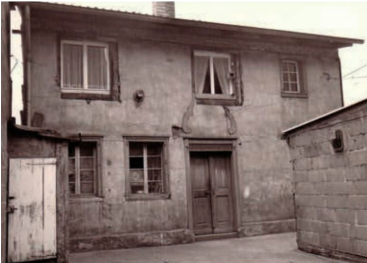
Aufnahme der früheren Frechener Synagoge (1967).