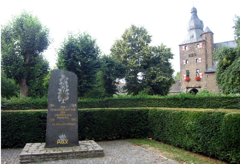
Der kleine Park mit dem Gefallenendenkmal in Hürth-Efferen, im Hintergrund Burg Efferen (2013).