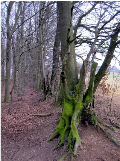
Landwehr als Grenze des Reichswaldes in Bedburg-Hau (2012)