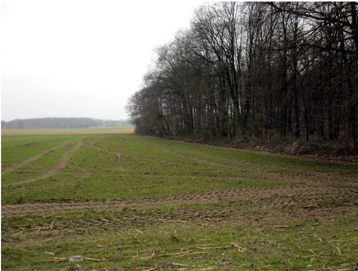
Waldrand am Treppkesweg im Reichswald (2012)