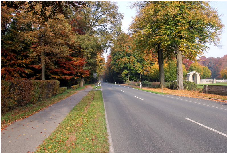
Landesstraße (Grunewaldstraße) am Eingangsbereich zum Ehrenfriedhof im Reichswald bei Kleve (2012)