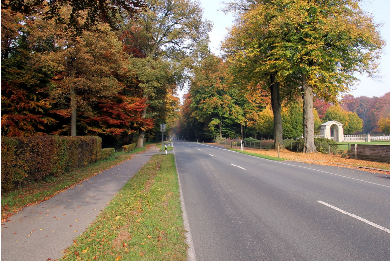
Landesstraße (Grunewaldstraße) am Eingangsbereich zum Ehrenfriedhof im Reichswald bei Kleve (2012)