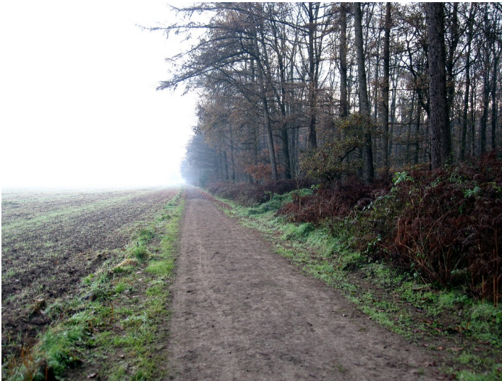
Forstweg (Jagenweg) im ehemaligen Reichswalde (Nierswalde) (2011)