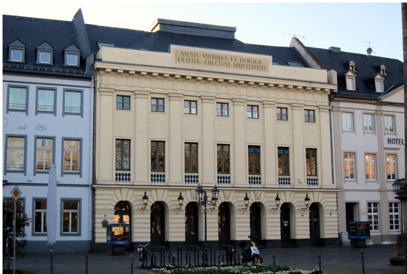
Das Koblenzer Stadttheater am Deinhardsplatz (2014)