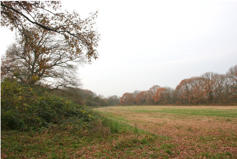
Fliehbürg in der Flehbachaue (2014)