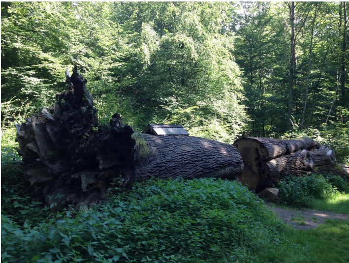
Umgestürzte Dicke Eiche im Kottenforst (2013)