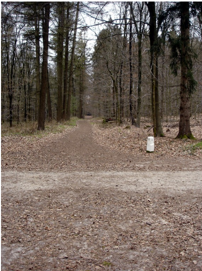
Grenzstein am sogenannten "D-Gestell" (Rendezvous) im Klever Reichswald (2012). Hier kreuzen sich die Jagenwege (Gestelle), die den Reichswald in Abteilungen aufgliedern.