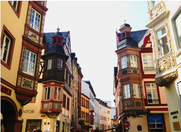
Denkmalzone „Vier Türme“ im Kreuzungsbereich der vier zentralen Altstadtstraßen in Koblenz (Am Plan, Altengraben, Löhrrstraße und Marktstraße, 2013)