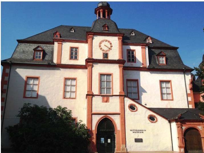
Das alte Kauf- und Rathaus am Florinsmarkt in Koblenz (2013).