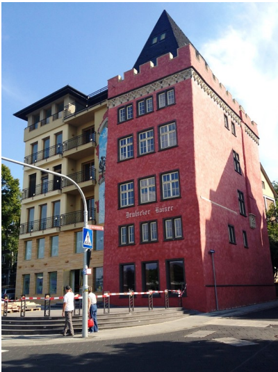
Der gotische Wohnturm "Deutscher Kaiser" in Koblenz (heute Wohnhaus und Gaststätte, 2013)