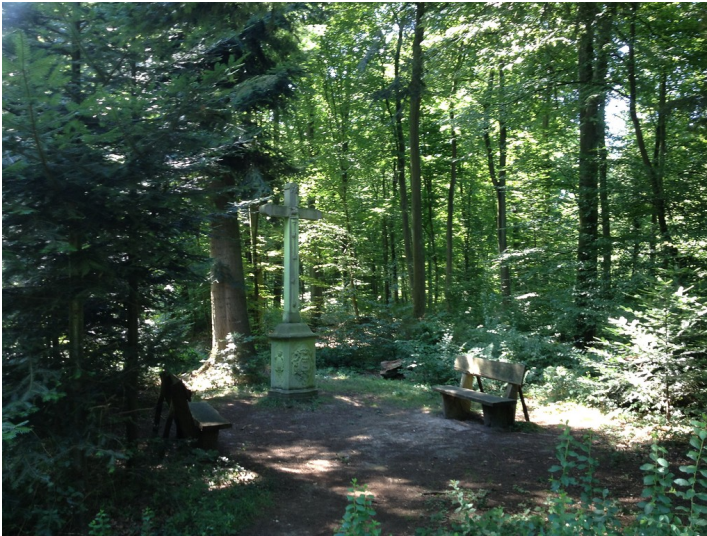
Jakobskreuz im Kottenforst (2013)