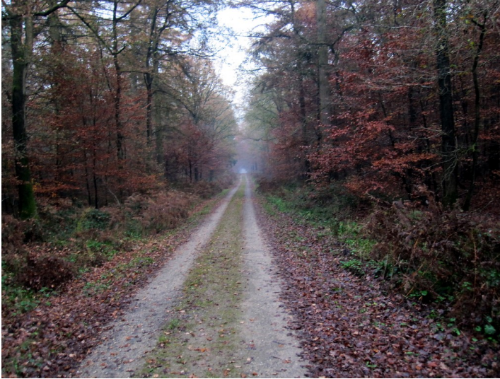
Forstweg (Jagenweg) im Reichswald (2011)