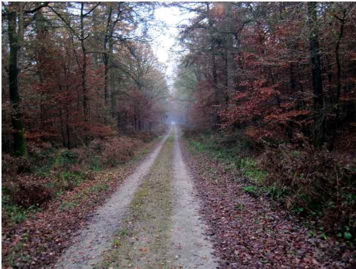
Forstweg (Jagenweg) im Reichswald (2011)