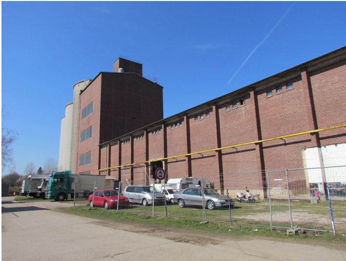
Die Gebäude der ehemaligen Sackabfüllung der Zuckerfabrik.