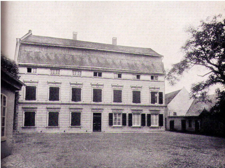
Wohnhaus der Familie Schoeller auf dem Schoellershammer, undatiert