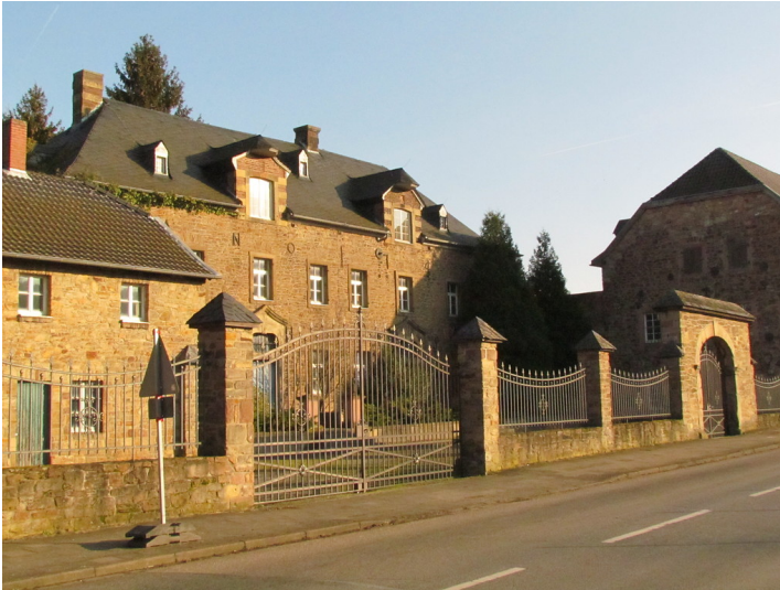
Das historische Stammhaus der Familie Hoesch in Schneidhausen