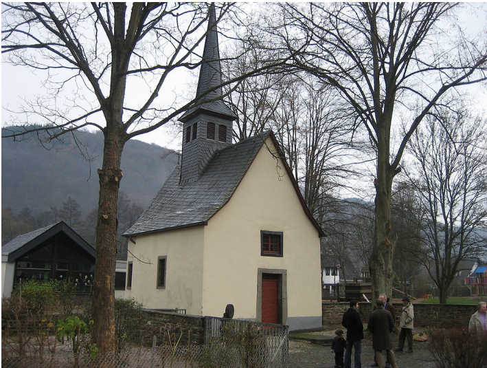
Die 1637 erbaute Rochuskapelle in Ahrbrück (2008).