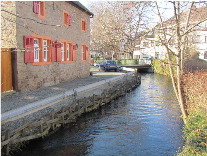
Der Kreuzauer Mühlenteich im Ort Kreuzau