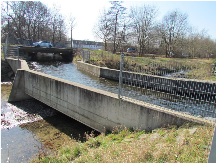
Lendersdorfer Mühlenteich, der in Düren-Rölsdorf über einen Aquädukt den Geybach/Birgeler Bach überquert