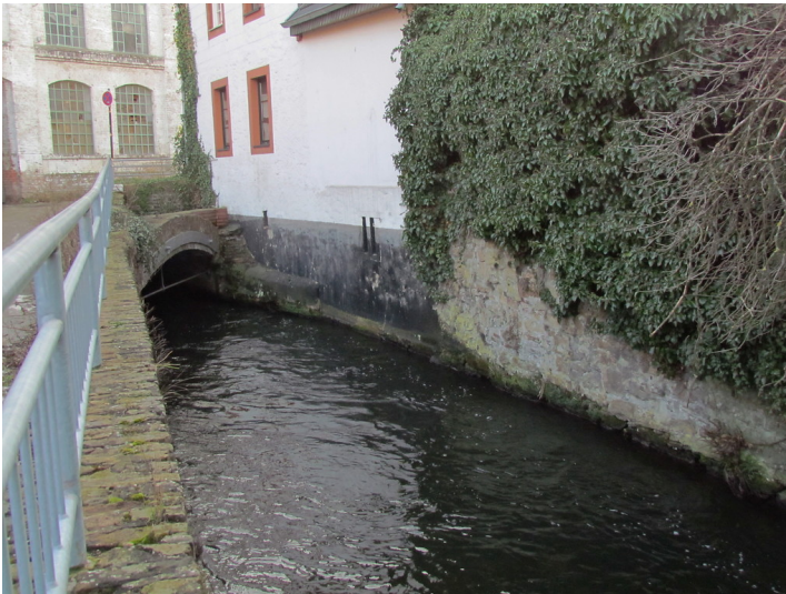
Lendersdorfer Mühlenteich an der ehemaligen Lendersdorfer Hütte im Ortszentrum Lendersdorf