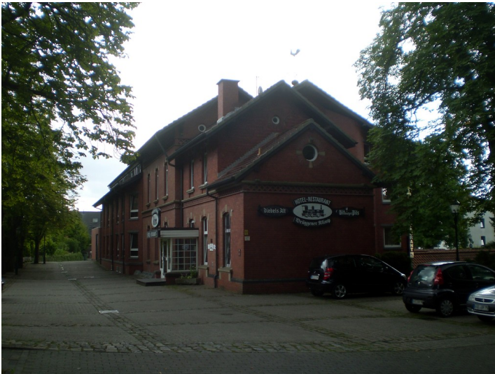
Ehemaliges Empfangsgebäude des Bahnhofs Brüggen (2012)