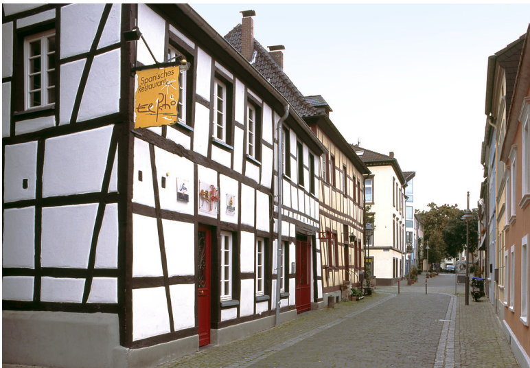
Brühl, Denkmalbereich Nordwestliche Altstadt