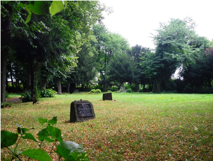
Alter Friedhof an der Kapellenstraße in Köln-Vingst (2013)