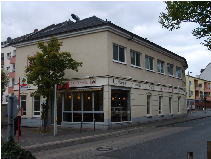
Eckgebäude Kuthstraße und Ostheimer Straße in Köln-Vingst (2013)