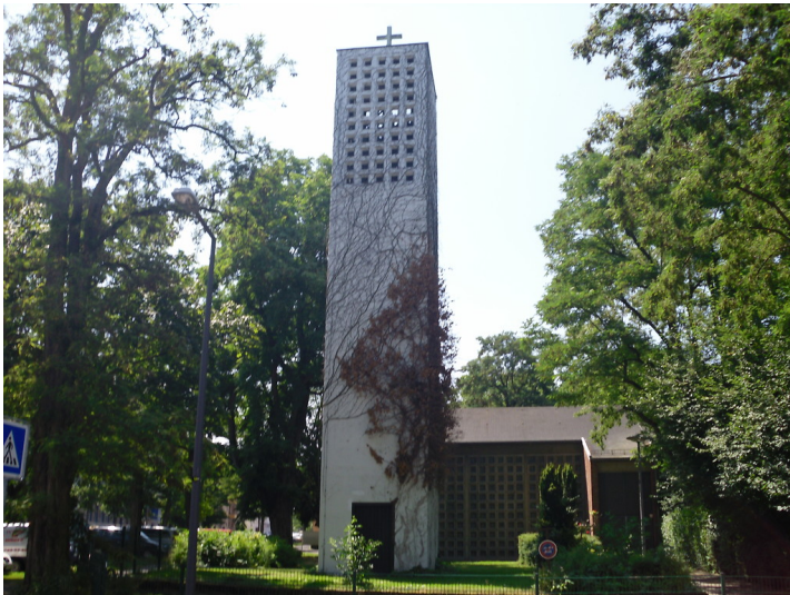
Evangelische Erlöserkirche in der Schulstraße in Köln-Vingst (2013)