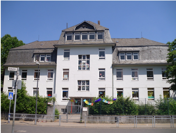
Ehemaliges Pflegehaus, später Schule in der Schulstraße in Köln-Vingst (2013)