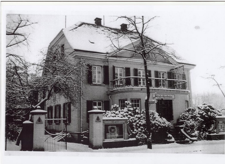
Alte Apotheke in Runderoth