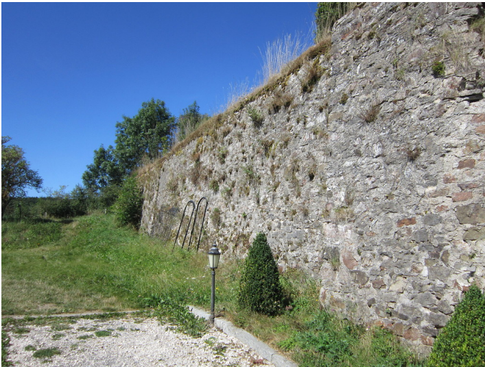
Burg in Dahlem-Kronenburg. Umfassungsmauer am Burghaus (2016).