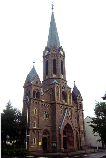
Torso der früheren Kirche Sankt Sebastianus in Bornheim-Roisdorf (2013)