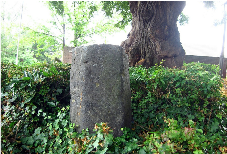
Gerichtslinde und "Blauer Stein" in Bornheim-Walberberg (2013)