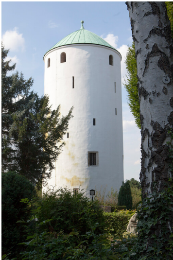
Hexenturm in Bornheim-Walberberg (2015)