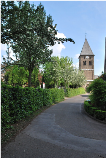
Blick durch die Straße "An der Dränk" auf die romanische St. Martinus-Kirche in Esch. Links im Bild zu sehen ist der durch eine Hecke eingefasste Friedhof (2014).