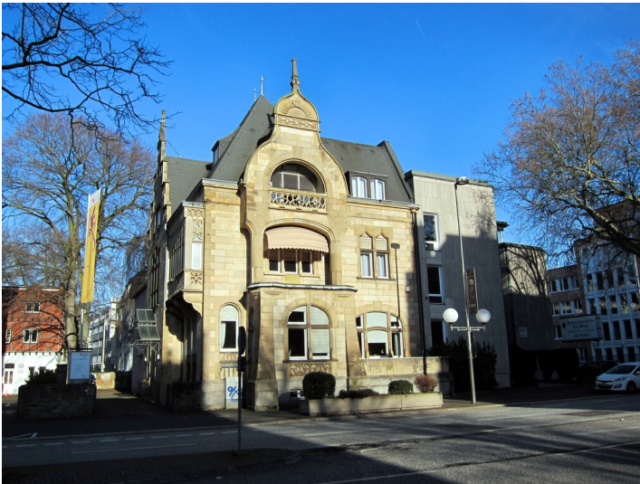
Halbvilla Ermekeil (2015)