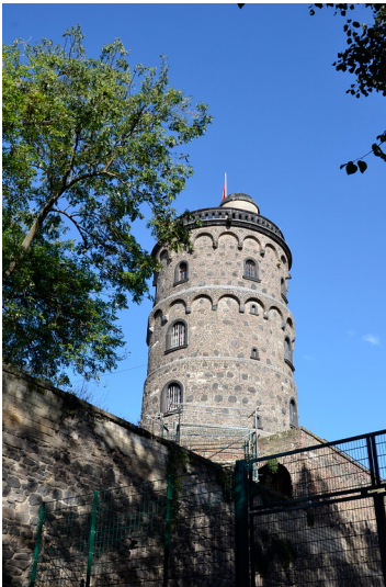
Bottmühle in Köln in der Rückansicht (2014)