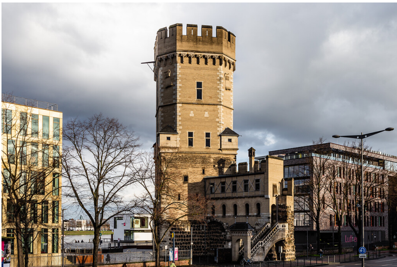
Bayenturm in der Kölner Südstadt (2020), Ansicht von Westen.