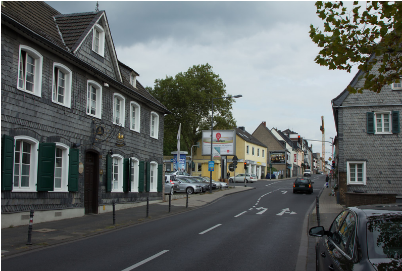
Die Olpener Straße in Köln-Brück (2013)