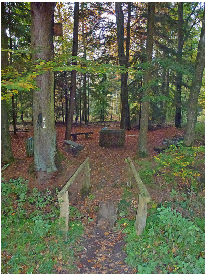
Jakobsbrunnen im Dämmerwald bei Schermbeck (2012)