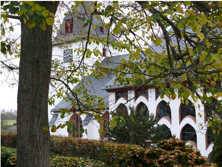
Die Katholische Pfarrkirche St. Vinzenz in Kelberg mit dem angebauten Seitenschiff, Ansicht von der so genannten "Köttelbacher Seite" aus (2008).