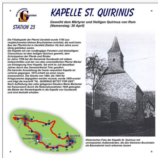
Informationstafel: Geschichtsstraße Abschnitt 1: Route Uersfeld-Gunderath, Station 23 Kapelle St. Quirinus.