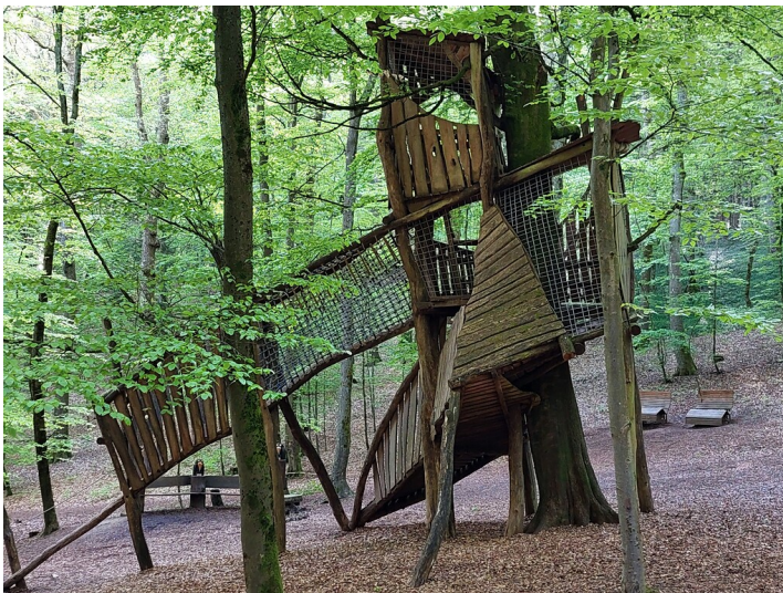
Klettergerüst auf einem Waldspielplatz nahe des Ferienparks Heilbachsee bei Gunderath (2021).